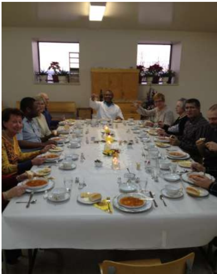
Souper du Conseil de la Fabrique de Saint-Siméon